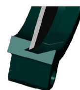
Уплотнение металл / металл