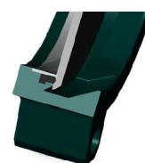
Уплотнение с эластомером