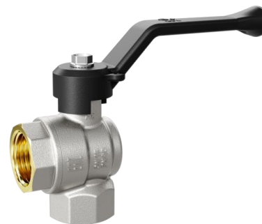
Модель LD Pride 47.15.B-B.Y.P LD Pride 47.20.B-B.Y.P LD Pride 47.25.B-B.Y.P