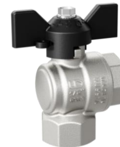
Модель LD Pride 47.15.B-B.Y.B LD Pride 47.20.B-B.Y.B LD Pride 47.25.B-B.Y.B