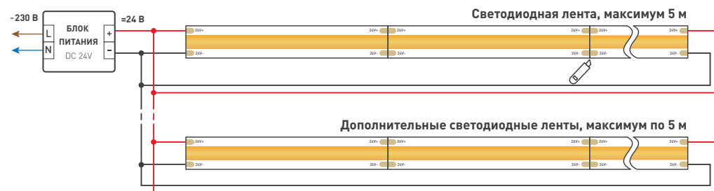
Схема 1. Подключение нескольких светодиодных лент с двух сторон Рекомендуется использовать для обеспечения равномерного свечения ленты по всей длине.