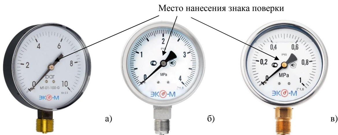
Рисунок 2 – Общий вид манометров, вакуумметров и мановакуумметров а) МД01 и МД02, б) МД90, в) МД93, обозначение места нанесения знака поверки