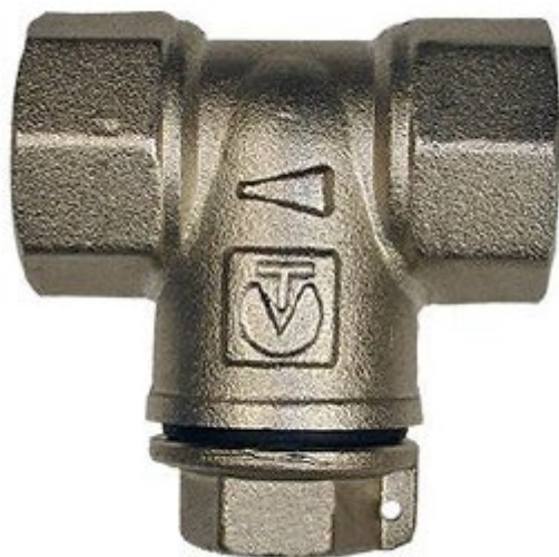
ФИЛЬТР МЕХАНИЧЕСКОЙ ОЧИСТКИ МАЛОГАБАРИТНЫЙ, ЛАТУННЫЙ, ПРЯМОЙ

Произведено по технологии: VALTEC s.r.l., Via Pietro Cossa, 2, 25135-Brescia, ITALY Изготовитель: TAIZHOU JIAHENG VALVES CO.,LTD, Huxin Village, Chumen Town, Yuhuan County, China