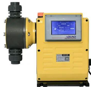
Внимание! Фото товара может отличаться от реального

Перекачиваемая жидкость = Вода Температура перекачиваемой жидкости = 20 °C Плотность = 998.2 кг/м³